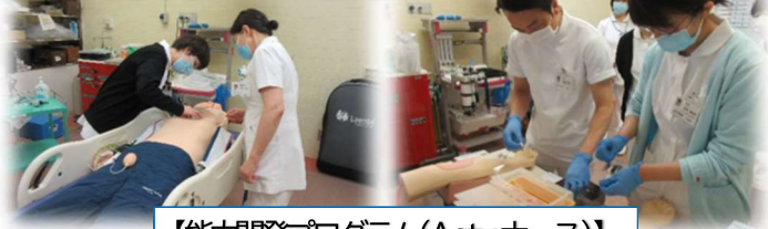
【能力開発プログラム(Actyナース)】